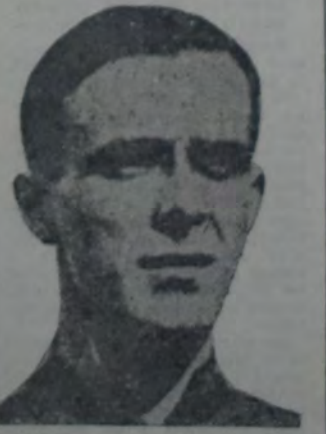
QUE INTEGRANDO EL EQUIPO olímpico en el match de beneficio de anteañoche, a pesar de no contar con un compañero de ala eficiente, se comportó a la altura de sus antecedentes.

12, 16, 17 y 23 en su nuevo local social de la calle Gaona 805, esta entidad ha organizado siete reuniones danzantes. Se iniciarán a las 10.