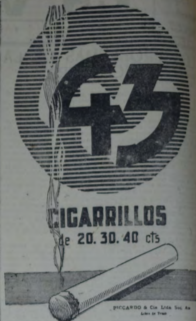
PICCARDO & Cia Lida S.A. Libros de Traves