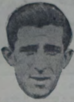
EL POPULAR MEDIO ZAGUERO olímpico que reprodujo en el match de anteaño una de sus destacadas performances.

defendiendo su valla realizó jugadas destacadas culminando su actuación al detener un penal.