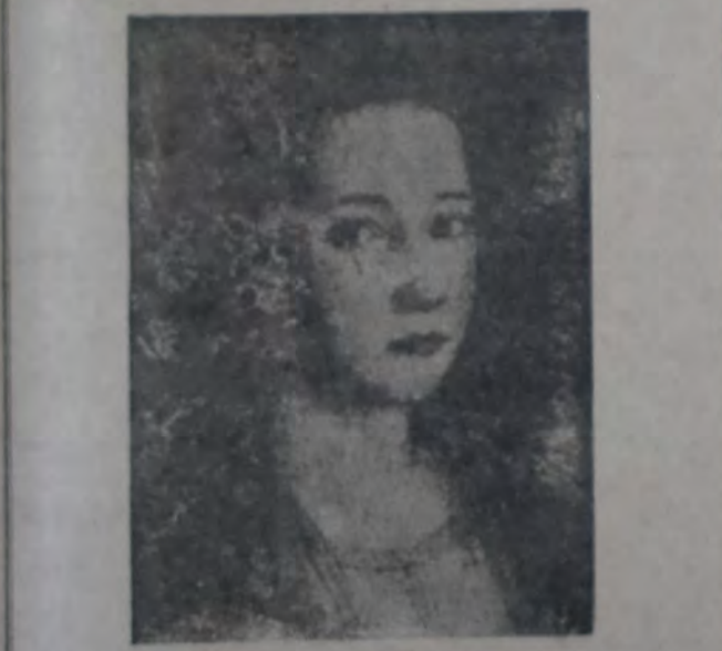
PEDRO NOVELLI. — "Retrato de desconocido"