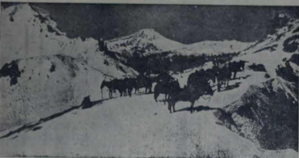
UNA ESCENA DE LA CORDILLERA BAJO LA NIEVE.

A todas estas consideraciones, que van minando el ánimo del chacarero, hay que agregar un factor sentimental que todavía no se ha tomado en cuenta; mucho del malestar que actualmente se advierte se debe, no tanto a la pérdida que ha sufrido el campo este año, sino a que al colono no vive tranquilo. Muchos chacareros me han manifestado que para ellos todavía la situación no se presenta desesperada, pero han perdido el optimismo. La noticia cierta de la baja del trigo y los persistentes rumores de que existe entre los arrendatarios un propósito de subir aún más los alquileres han determinado un estado de desconfianza en el porvenir, que hace ver la situación actual, no como un mal momento pasajero, sino como el comienzo de una época de derrumbamiento que impresiona, no tanto por lo que es, materialmente hablando, sino por lo que contiene de presagio.