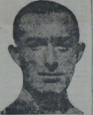
EL VETERANO DEFENSOR DE Sp. Buenos Aires, que en el partido nocturno del jueves tuvo una buena actuación, marcando a la vez pareja Pucelle-Arrillaga.

que al bien el primer tiempo sólo acusó relativo interés, el segundo se desenvolvió en forma sumamente reñida por el entusiasmo de los jugadores que se contagiaron a los espectadores los cuales vociferaron continuamente a sus favoritos hasta finalizar la lucha.